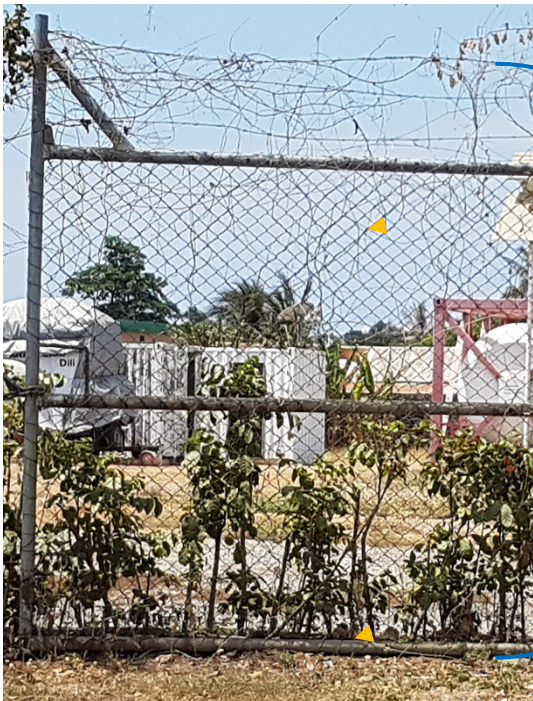
LA ASEITÁVEL 2

Nota: Lutu ida ne'e la prevene interferensia . Besi metal lolon mos separadu no fasil atu sai.