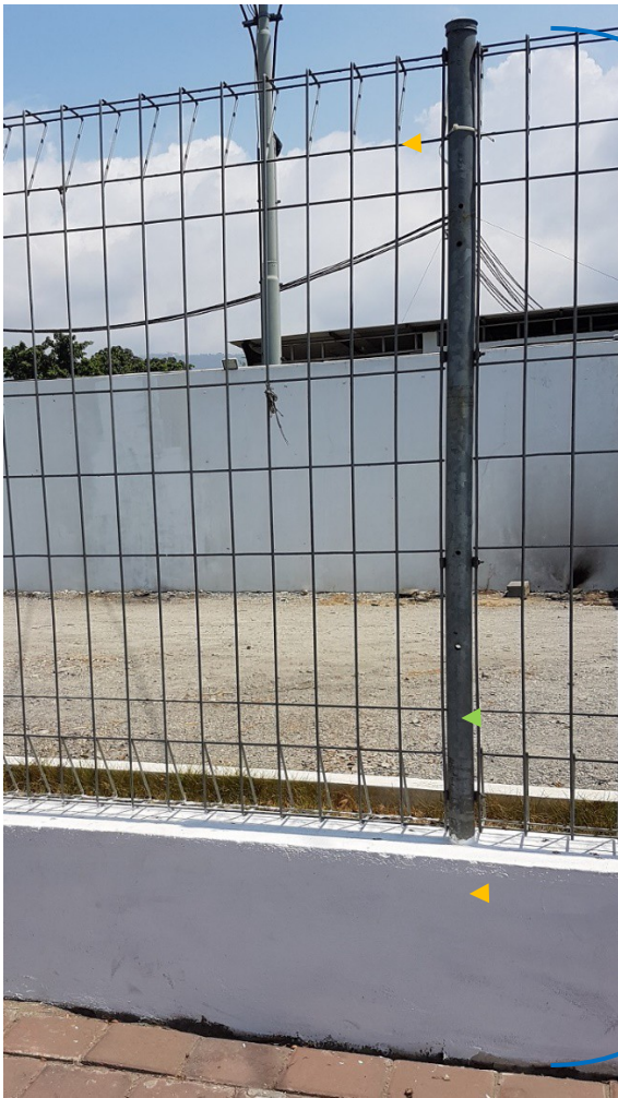
LA ASEITÁVEL 1

Besi metal lolon (Gavanis) (seksaun importante)